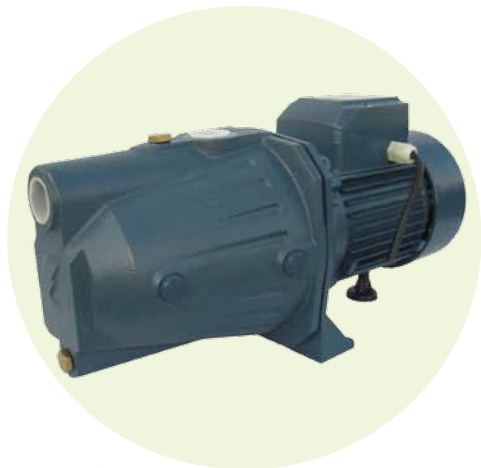
BJm100LB (1.0 HP)